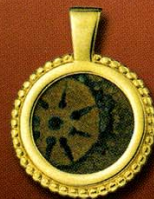
עדיליון "המכבים" זהב (ללא שרשרת) מק"ט: 6121913 מחיר למנוי - 379 ש"ח