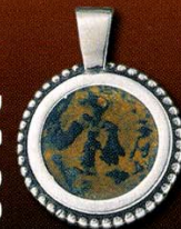
עדיליון "המכבים" כסף, כולל שרשרת מק"ט: 81219402 מחיר למנוי - 199 ש"ח